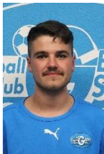
Lorenz Schmutz Marketing