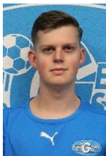
Lars Zulliger Kommunikation